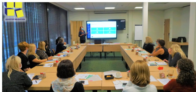
Pictures From Our Workshop in the Netherlands

Os parceiros do PLANet B também aproveitaram esta oportunidade para trabalharem no relatório final e para partilhar o feedback dos eventos e da pilotagem feitos em cada país.