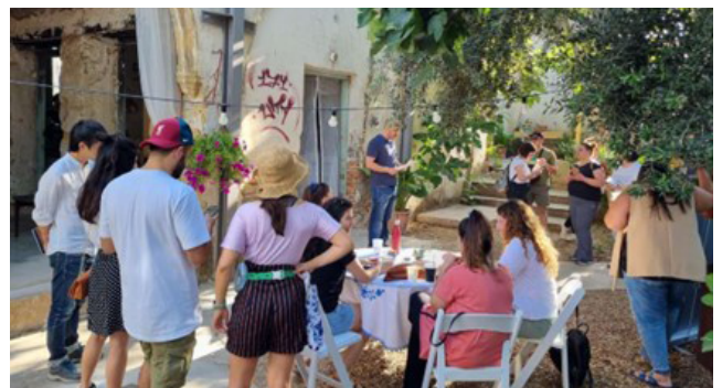
Εργαστήριο στην Κύπρο