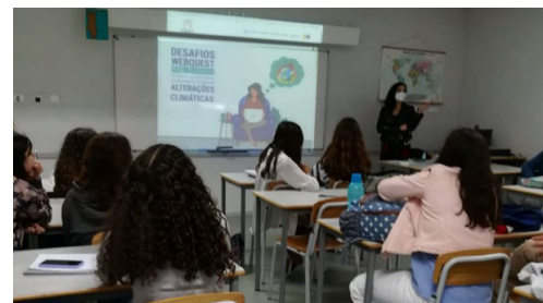
Εργαστήριο στην Πορτογαλία