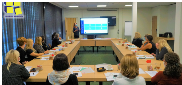
Εργαστήριο στην Ολλανδία

Οι εταίροι αξιοποίησαν τη συνάντηση και ως ευκαιρία να εργαστούν με τα υποδείγματα της τελικής έκθεσης και να μοιραστούν σχόλια από τις εκδηλώσεις προώθησης και την πιλοτική εκπαίδευση σε κάθε χώρα.