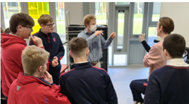
Εργαστήριο στην Ιρλανδία