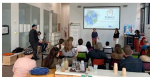
Εργαστήριο στη Γαλλία

https://m.facebook.com/Planet-B-108388667627519/?ref=page_internal&_tn_=-C-R